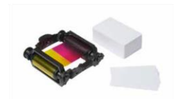
Consumables pack for 100 prints (color ribbon and cards)