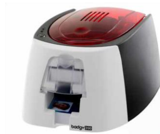
Badgy200 card printer